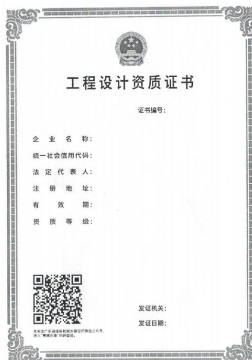
工程设计资质证书