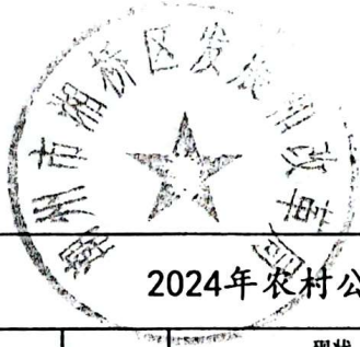
2024年农村公路建设项目基本信息表