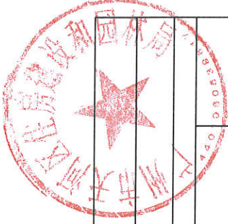
地下管线探测及地形图测绘综合评分表