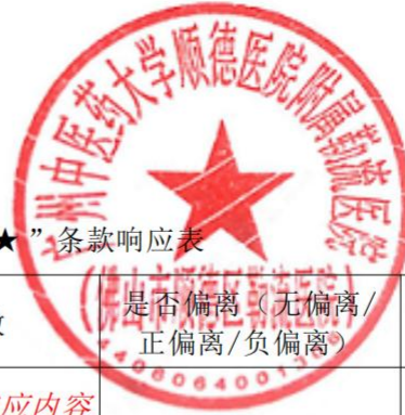
(1) 实质性指标“★”条款响应表