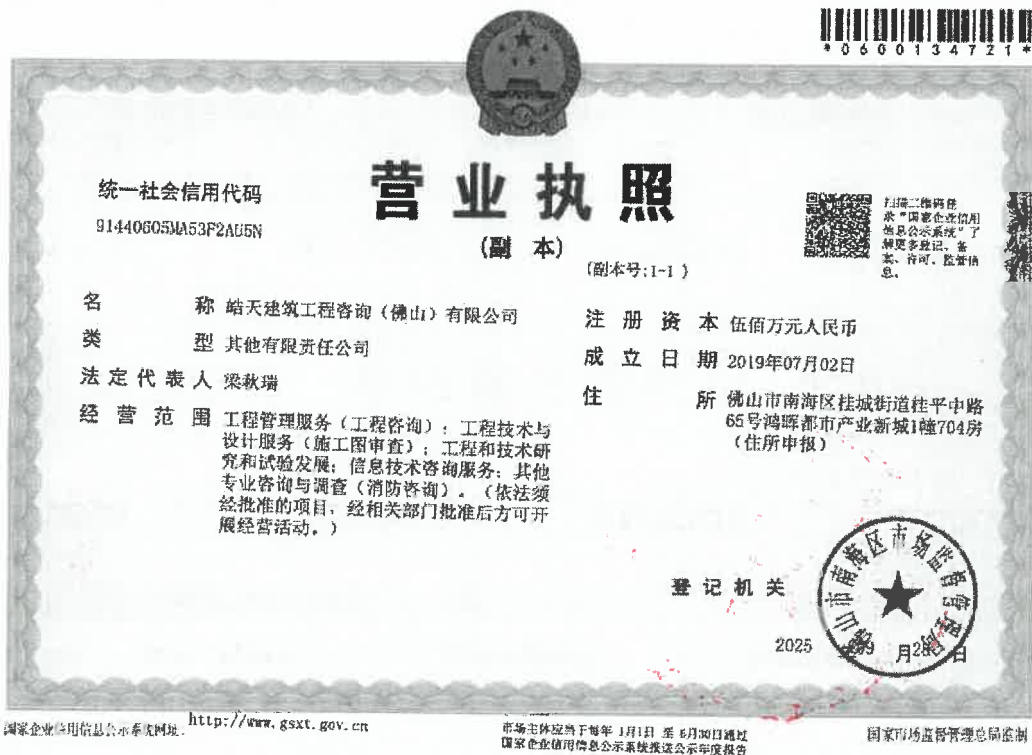
附件 2: 营业执照: