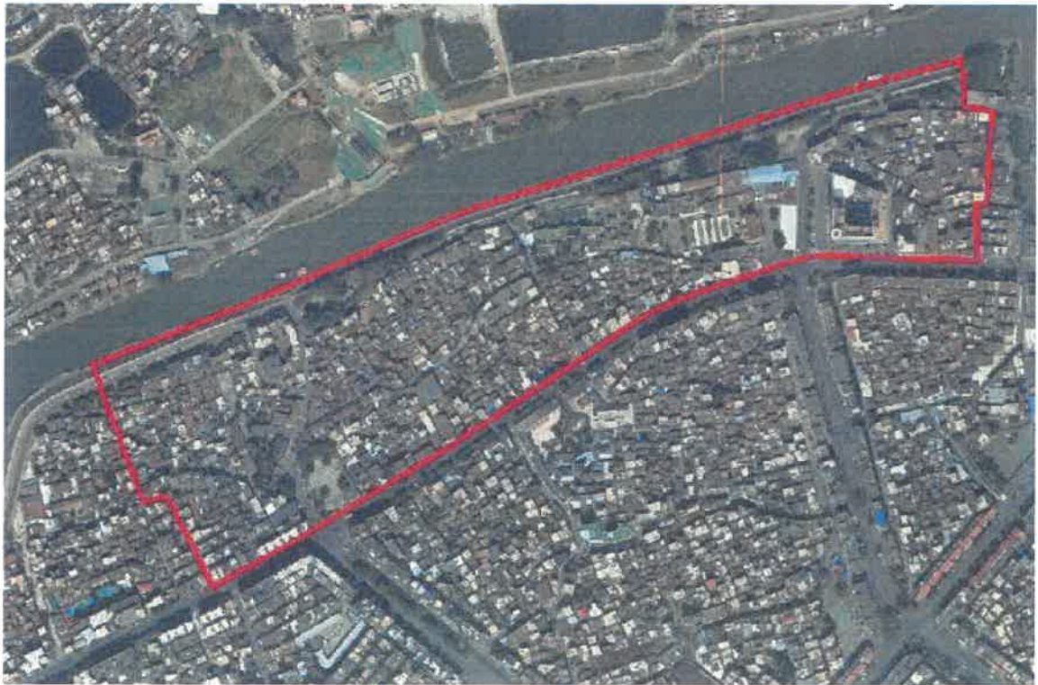
图一：项目范围示意图

本次范围从建设西路友谊路段至人民路段以北、悦来路以南的片区，包括友谊路、红棉路、大塘街等街巷，概念设计面积约为 18 公顷。